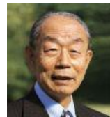
2代会長 福田赳夫元総理大臣