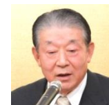
5代会長代行 江口一雄元衆議院議員