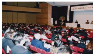
政府へ要請し実現を見た 「海底資源探査専用船」 運航を喜ぶ報告会風景 平成22年11月29日 星陵会館ホールにて開催