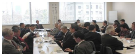
講師の話に 聞き入る参加者

当協会では、毎月1回、議員会館などの会議室にて、月例講話会を開催しております。この月例講話会では、時宜に応じて、国会議員や各分野の専門家・評論家をお招きし、国内外の諸問題について講話を聞き、意見交換を行なって知識と親睦を深めております。開催数も約40年間で通算720回に及んでおります。