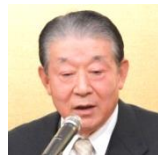
5代会長代行 江口一雄元衆議院議員