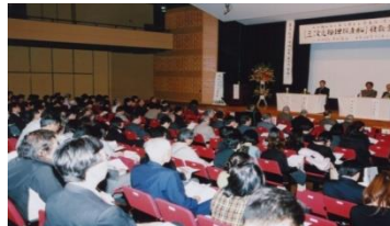
政府へ要請し実現を見た 「海底資源探査専用船」 運航を喜ぶ報告会風景 平成22年11月29日 星陵会館ホールにて開催