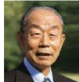
2代会長 福田赳夫元総理大臣