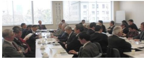
講師の話に 聞き入る参加者

当協会では、毎月1回、議員会館などの会議室にて正午より共に昼食をとり、そのあと、月例講話会を開催しております。この月例講話会では、時宜に応じて、国会議員や各分野の専門家・評論家をお招きし、国内外の諸問題について講話を聞き、意見交換を行なって知識と親睦を深めております。開催数も約40年間で通算680回を超えております。